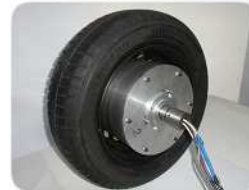
Silnik typu EMZm 60-12 zamontowany w standardowym kole pojazdu (widok od wewnątrz)

Silniki te są przeznaczone do napędu bezpośredniego małych ekologicznych pojazdów elektrycznych. Silniki te mają odwróconą strukturę, tzn. nieruchome wewnętrzne tworniki oraz magnesy umieszczone na zewnętrznym wirniku. Silniki mogą być umieszczane bezpośrednio w kołach pojazdu.