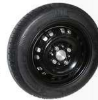
Silnik typu EMZm 60-12 zamontowany w standardowym kole pojazdu (widok z zewnątrz)

W Instytucie Elektrotechniki w Warszawie zostały zaprojektowane i wykonane modele bezszczotkowych silników prądu stałego typu EMZm 60-12 z zewnętrznym wirnikiem o następujących danych znamionowych i cechach konstrukcyjnych: