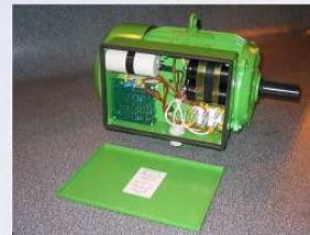
Widok silnika z odkręconą skrzynką zaciskową